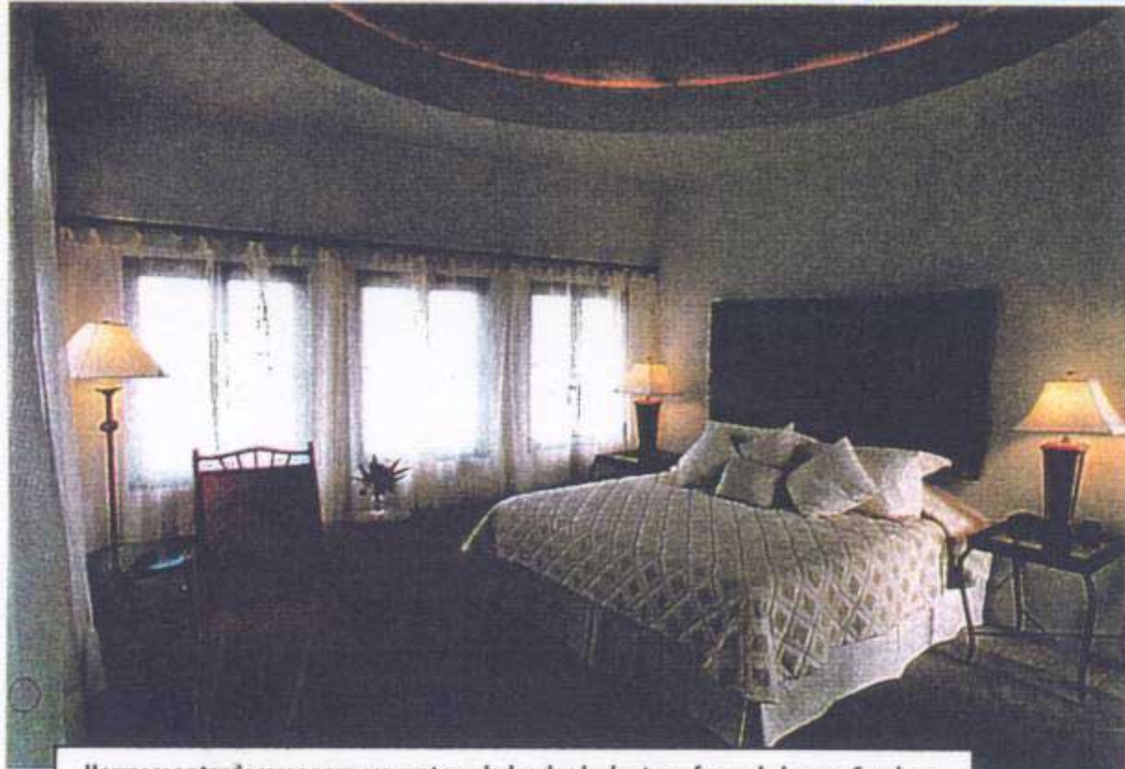
Hermosos atardeceres para ser contemplados desde dentro o fuera de la casa Cerulean.