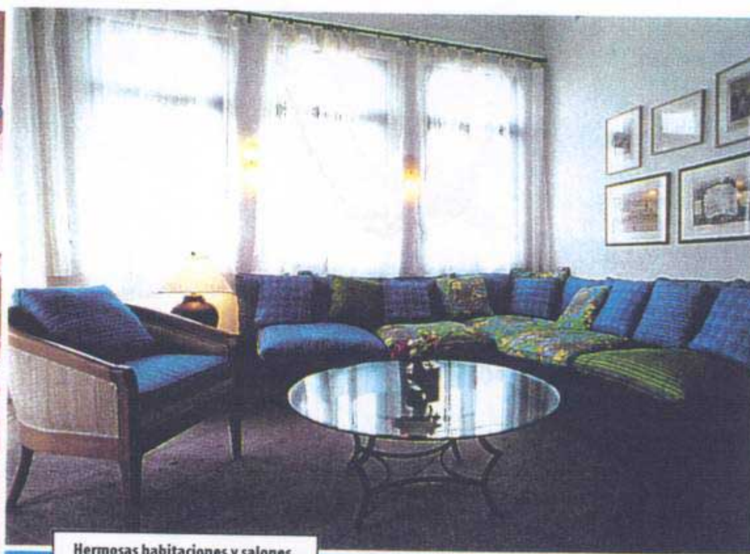
Hermosas habitaciones y salones.

Los deportes son también posibles en la grata estancia.